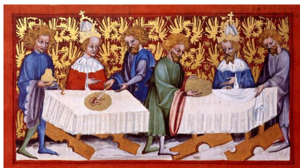
Das Kaiserpaar beim Krönungsmahl. Karl und Anna werden von je zwei Mundschenken bedient

„Im Monat Juni des Jahres 1353 kamen der Römische König Karl IV. und König Ludwig von Ungarn in der Stadt Ofen in Ungarn zusammen, und dort haben beide gleichzeitig Hochzeit gefeiert. König Karl führte die Tochter des Herzogs von Schweidnitz heim, die Erbin des Herzogtums. Der König von Ungarn ehelichte die Tochter des Herzogs von Bosnien.“