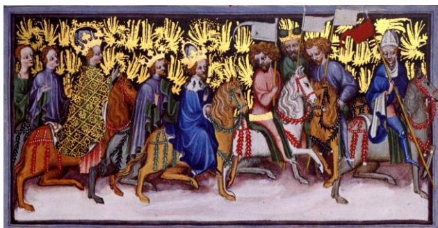
Zug des Kaiserpaares zum Reichstag. Der Erzkanzler reitet voraus, gefolgt von drei Kurfürsten, danach kommt der Kaiser Karl IV., darauf der König von Böhmen und schließlich die Kaiserin Anna mit drei Hofdamen

Auf der anderen Seite saß die Kaiserin auf einem Tische mit dem Kardinal von Perigord und dem französischen Kronprinzen, dem Herzog der Normandie, und den anderen Fürsten, Herren, Rittern und Knappen, die an anderen Tischen saßen. Alle wurden reichlich mit Speisen versorgt....Am genannten Weihnachtstage ließ der Kaiser in Gegenwart der Kurfürsten die Goldene Bulle veröffentlichen.