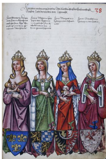
Die vier Gattinnen von Karl IV. aus dem Hallerbuch. Anna von Schweidnitz mit dem schlesischen Adler, ist die zweite von rechts