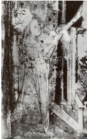
Anna in einem Fresko über dem Altar der Katharinenkapelle auf der Burg Karlstein

Im Jahr 1360 war Anna wieder schwanger und Karl ließ sie nach Nürnberg bringen. Auf der Burg, in der Mitte des Reiches sollte der eventuelle Thronfolger geboren werden. Und am 26. Februar 1361 schenkte sie einem Knaben das Leben. Sofort ließ die Kaiserin an den Papst berichten: