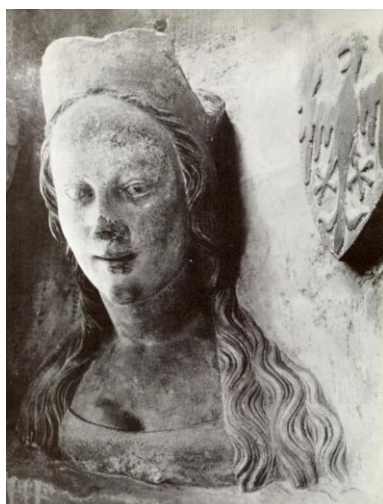
Die Sandsteinbüste der Anna v. Schweidnitz in der Triforiumgalerie des Prager Domes von Peter Parler um 1383