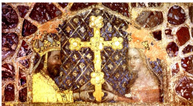
Kaiser Karl IV. und Kaiserin Anna bei der Kreuzverehrung. Fresko über dem Eingang zur Katharinenkapelle auf Burg Karlstein bei Prag um 1357

Anna war inzwischen 19 Jahre alt und erwartete im Frühjahr 1358 ihr erstes Kind. Am 18. März gebar sie auf der Prager Burg eine Tochter Elisabeth, die wahrscheinlich ihren Namen zu Ehren der Erzieherin Annas und der Königinmutter von Ungarn erhalten hat. Karl gab die Geburt mit besonderen Briefen an alle Fürsten und Städte bekannt.