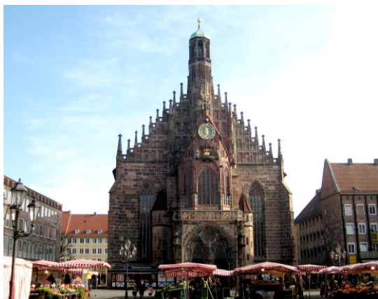
Die Frauenkirche am Hauptmarkt in Nürnberg

Im Herbst 1354 begab sich Karl nach Oberitalien und Anna folgte ihm im Januar 1355, um die Kaiserkrönung vorzubereiten. Obwohl der Papst zu dieser Zeit noch in Avignon residierte wurde das Kaiserpaar durch seinen Vertreter, den Kardinalbischof von Ostia, am 05. April 1355 zum Kaiser bzw. zur Kaiserin gekrönt. Damit hatte die sechzehnjährige Anna bereits den höchsten gesellschaftlichen Rang im Reich erreicht. Nach der Rückkehr aus Italien stiftete Kaiser Karl am 08. Juli 1355 in Nürnberg am Hauptmarkt zu Ehren Mariens die Frauenkirche.